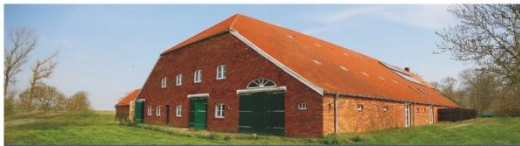
Willkommen im "Uplewarder Grashaus"